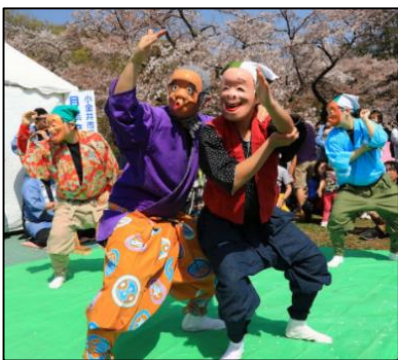
さくら 桜 ぬくいばやし まつりと ぬくいばやし 貫井噺子

げいのう・お祭り・・・ こがねい むかしから ひと 小金井の人たちに うけつ うけつがれてきた げいのう げいのうが たくさん たくさんあります。なかでも、「 ぬくいばやし 貫井噺子」「 こがねいばやし 小金井噺子」「 せきのちやうもち 関野町餅つき」は、 し 市の むけい 無形 みんぞく 民俗文化 ぶんかざい 財として、 いろい いまでも いろい 色々な ばしよ 場所 ばしよ でおひろめされています。また、 いま いまでは こがねい 小金井のお祭り まつ といえは、 はる 春の さくら 桜 まつり まつりや なつ 夏の あわ 阿波 ゆうめい おどり ゆうめい が有名です。