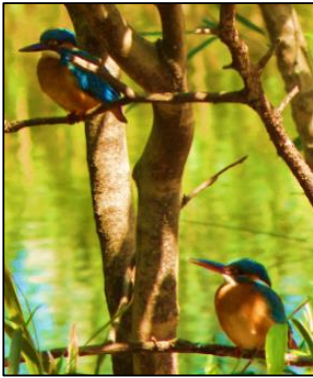
し 市の鳥 とり カワセミ

はげ・・・ こがねいし 小金井市を とうざい 東西に走る はし 高さ たか 15mほどの こがねい がけのことを、むかしから こがねい 小金井の人たちは「はげ」と呼んできました。はげの下からは しみず きれいな水が のがわ たくさんわきだし、その水があつまって のがわ 野川になりました。野川の近くには じんじや たくさんの いせき いせきや じんじや 神社などがあり、 こがねい 小金井の人たちにとって、はげは ひと とてもたいせつなものだったことがわかります。