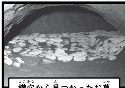
よこあな み はか 横穴から見つかったお墓

み 見つかっている遺跡の数は少なく、この時代の 小金井にはムラはなかったようです。それでも、 野川の近くからは生活のあとやお墓が見つかって います。お墓はがけの なかほどにあり、地面 をトンネルのようにく りぬいた横穴の中にあ りました。