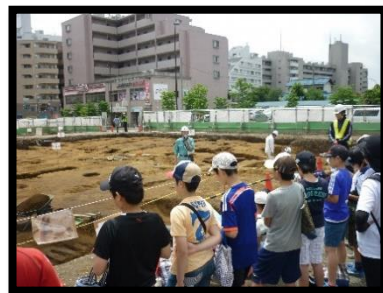
ほんちやうろくろよつめいせき 本町六丁目遺跡 しょうがくせいけんがくかい ようす 小学生見学会の様子

じぶん の ご せんぞ 自分のご先祖 さまがそこに いたのかも… って考えると、 わくわくして くるよね♪