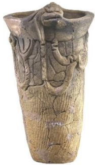
じょうもんどき 縄文土器

おも いせき むくいいせき なかざんやいせき まえはらいせき しんばしいせき 主な遺跡…貫井遺跡、中山谷遺跡、前原遺跡、新橋遺跡など