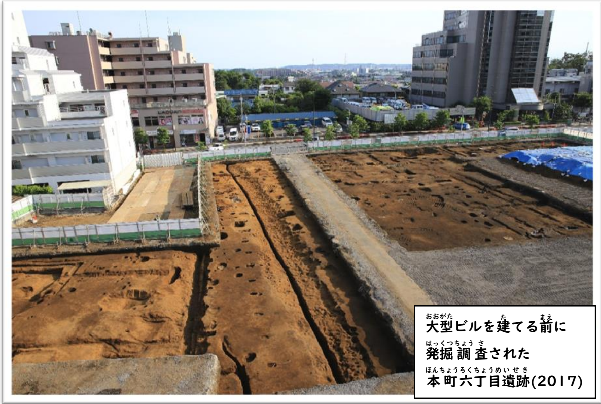
おおがた 大型ビルを建てる前に はっくつちようさ 発掘調査された ほんちようろくちようめいせき 本町六丁目遺跡(2017)