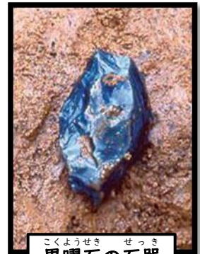
こくようせき せつき 黒曜石の石器

ひとびと こがねい 人々が小金井の「はけ」エリアにあらわれたのは、約 3万5千年前の大むかしのことでした。野川のほとりか らがけ治いの高台にかけて、多くの遺跡があり、石器や 火おこしのあとがたくさん発見されています。獲物を追 いかけて移動生活をしていた当時の人々にとって、小金 井はキャンプに適した場所だったのでしょ。